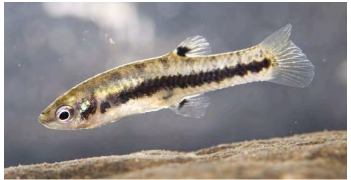
Heterandria formosa - Dwergtandkarper