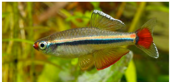
Tanichthys micagemmae - Vietnamese danio

in de handel ontmoeten. Halfsnavelbekjes kunnen ook ingezet worden omdat ze hun voer uitsluitend aan het wateroppervlak zoeken.