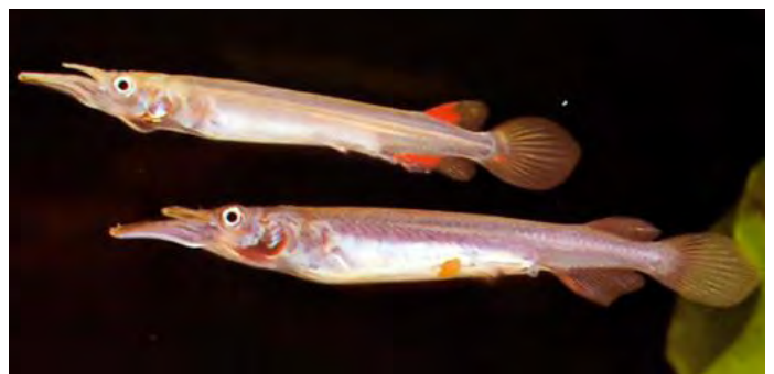
Dermogenys pusillus - Halfsnavelbekje