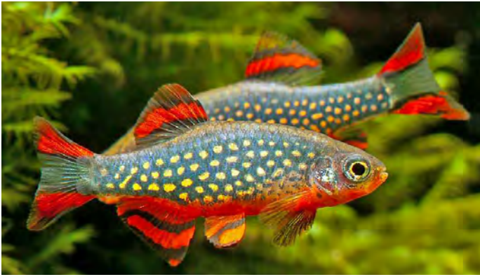
Danio margaritatus - Pareldanio

gewenst effect. Een uitzondering is de Pareldanio ( Danio margaritatus ), die wat schuwer en rustiger is. In een dicht beplant aquarium moet je hem soms zoeken of met voer voorin lokken.