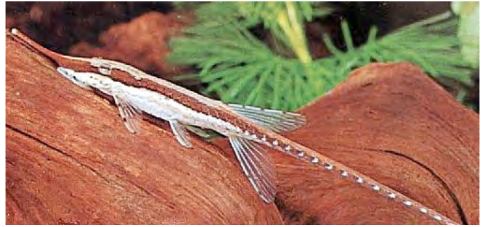
Farlowella acus - Naaldmeerval

Kleine levendbarenden zoals platys die zich amper over de bodem bekommeren, zijn in principe geschikt. Dat ze af en toe een babygarnaal oppeuzelen is natuurlijk niet uit te sluiten. Nog vredelievender zijn de dwergtandkarpers ( Heterandria formosa ), die we de laatste tijd weer meer