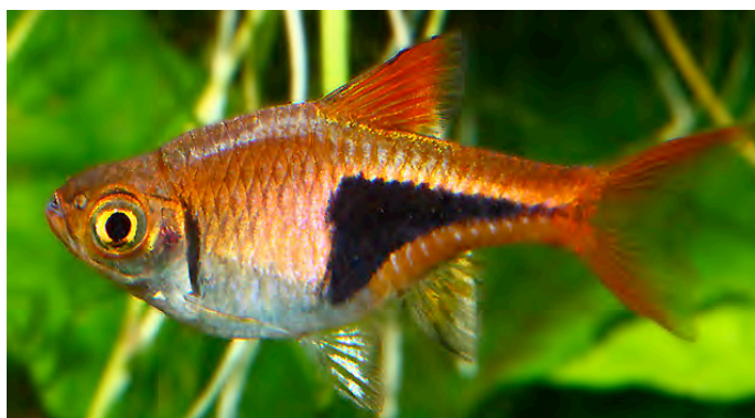
Trigonostigma heteromorpha - Kegelvlekbarbeel