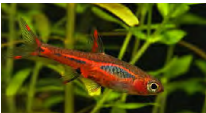
Boraras brigittae - Muskietrasbora

Hier zijn een paar soorten prima geschikt. Vooral de kleine Boraras-soorten zijn ideaal gezelschap. Ze worden amper groter dan 25 mm en bewonen de middenlaag van het water. Ze kunnen in principe op droogvoer, maar 2x per week is het voeren met Artemia-naupliën wel aangewezen. Die lusten de garnalen trouwens ook. Ook de 4 soorten kegelvlekjes (Trigonostigma) zijn vreedzame medebewoners. Ze zoeken zelden het bodembereik op en storen dus de garnalen niet. Ze houden ook van licht zuur en zacht water; dan tonen ze hun mooiste kleuren. Seemandelbladeren en elzenproppen onderin het aquarium zijn nuttig om de beste waterwaarden te bereiken. Maar ook andere soorten zoals Rasboroides of Sundadanio's die niet groter worden dan 30 mm komen in aanmerking. Bij de Danio-soorten zijn het vooral de kleine soorten die geschikt zijn. Ze zijn in ieder geval zeer levendig en brengen beweging in het aquarium, altijd een