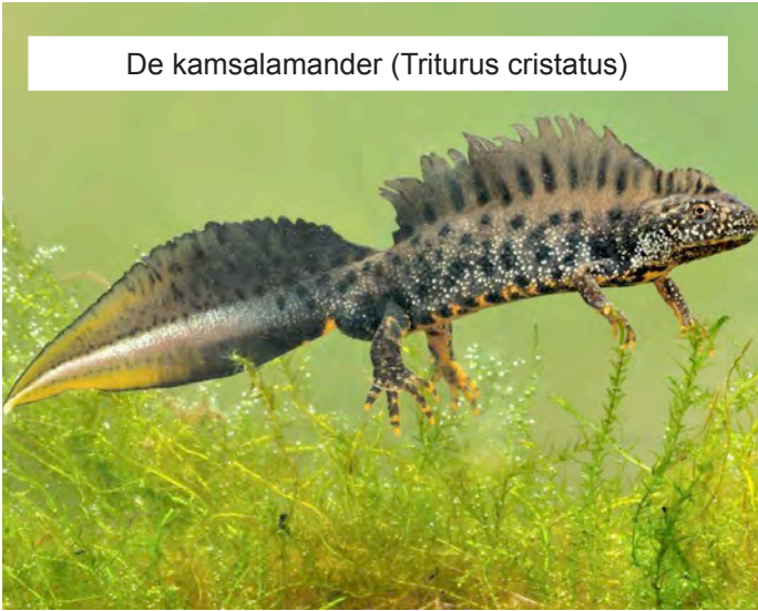
De kamsalamander ( Triturus cristatus )