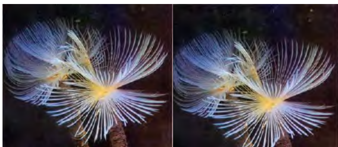
Honderden kleine witte kokerwormpjes verdwenen in betrekkelijk korte tijd.

De poliepen van mijn gorgoontakken zijn door deze vis met rust gelaten. Nu zegt het gedrag van een enkel exemplaar natuurlijk niet veel. Ik heb dan ook mijn ervaringen met deze vis bekend gemaakt aan de eigenaar van JB De Dierenwinkel in Utrecht die toen ook zo'n pincetvis in zijn grote showbak met lagere dieren liet zwemmen. Ook daar vertoonde de vis dezelfde gedragingen als hierboven omschreven. Door wat navraag hier en daar bij de liefhebbers bleken er veel mensen deze vis met hetzelfde resultaat te houden in een lagere-dierenbak. De Gestreepte Pincetvis is prima solitair te houden en laat de andere aquariumbewoners met rust, ook de op de pincetvis gelijkende vlindervissen worden na wat opgejaagd te zijn weer met rust gelaten. In de natuur