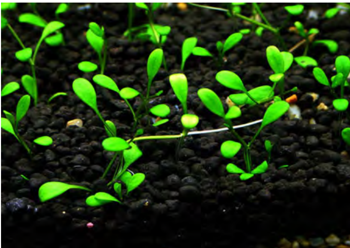
Glossostigma elatanoides is een vrij uitgesproken dominerende plant (of plantjes) in de Japanse aquariuscultuur.

Even een uitleg. De Japanse samenleving is verdeeld in ouderen (kohai) en jongeren (sempai). Dit komt terug in de aquascape. Zo zijn er enerzijds de dominerende planten, zoals de Glossostigma en de niet-dominerende planten, zoals de Rotala anderzijds. De niet-dominerende planten dienen als accent en worden buiten het centrum geplaatst.