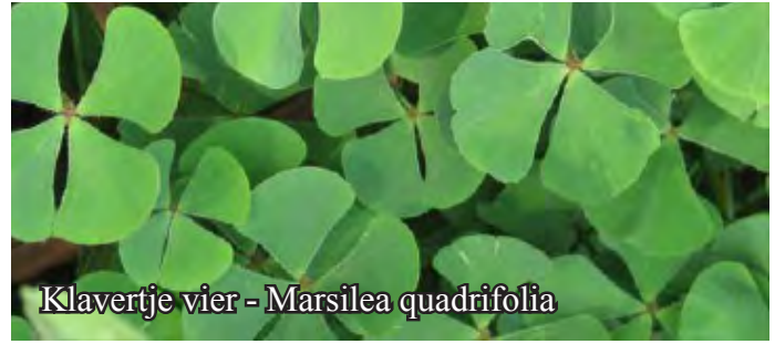
Klavertje vier - Marsilea quadrifolia