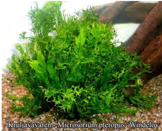
Kruljavavaren - Microsorium pteropus 'Windelov'