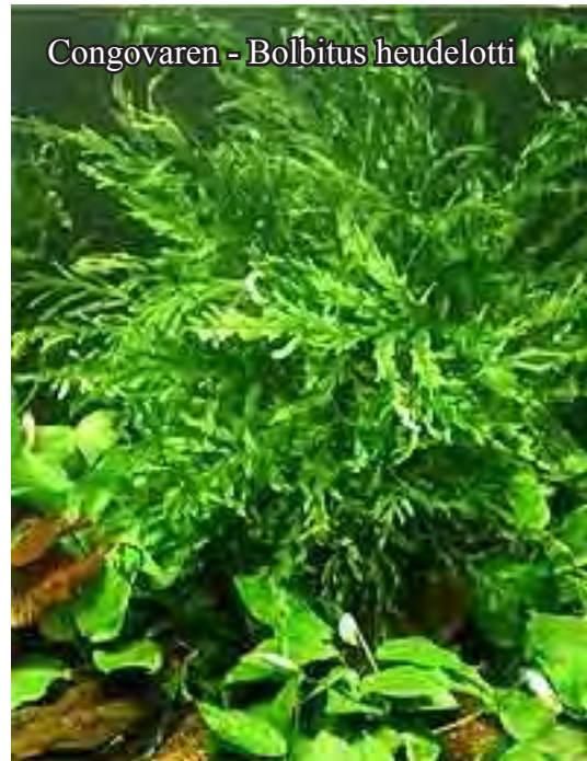
Congovaren - Bolbitis heudelotti

Deze komt uit Afrika. Ook deze plant groeit op hout, wand of stenen. De plant is erg contrastrijk, ze is echter niet zo gemakkelijk te houden als de voorgaande soort en heeft graag een kalkarm, vers stromend water en is daarom uitstekend geschikt om bij de uitstromer te plaatsen. De plant vormt een wortelstok met transparante donkergroene en geveerde bladeren. Het is een trage groeier die maar eens per twee maanden een nieuw blad vormt. Vermeerdering: via deling van de wortelstok, elk stuk met minstens drie bladeren.