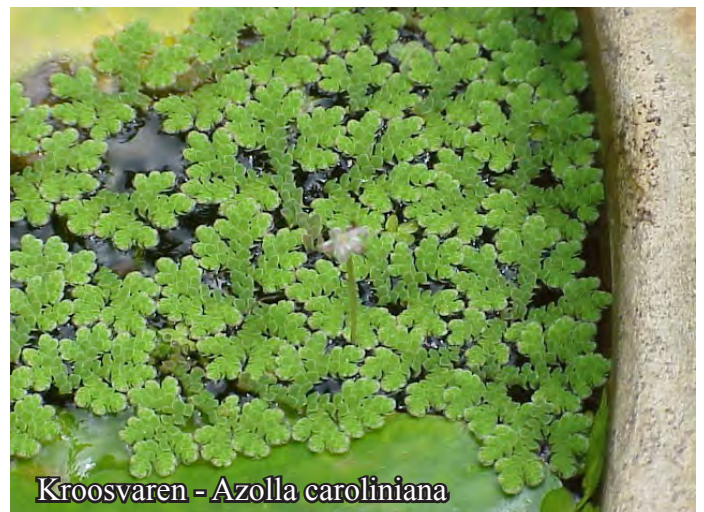
Kroosvaren - Azolla caroliniana

Azolla is een bijzonder drijfplantje uit de familie van de vlotvarens. De blaadjes bedekken elkaar dakpansgewijs. Aan de onderkant bevinden zich langen draadvormige wortels. De plantjes kunnen ongeveer 2,5 cm lang worden. In het aquarium zijn ze erg moeilijk te houden, terwijl ze het in de vijver uitstekend doen.