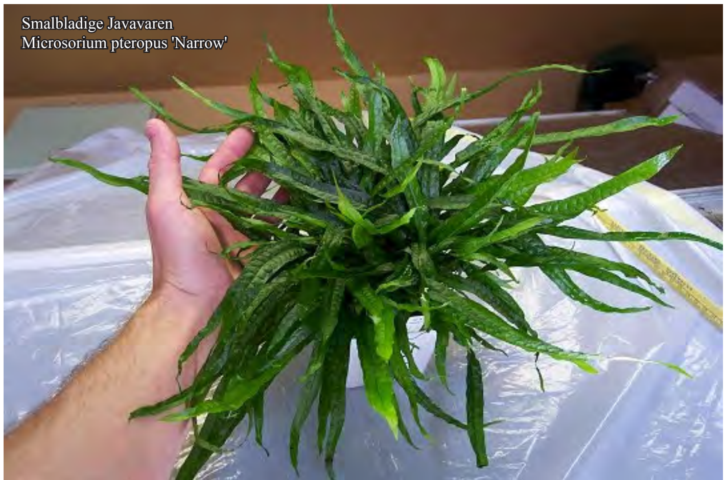
Smalbladige Javavaren Microsorium pteropus 'Narrow'