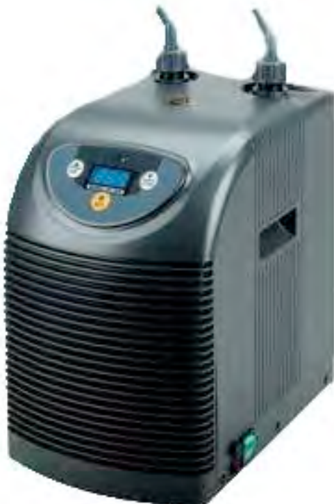
Dd Aquarium Koeler DC-300 - De DC 300 heeft een koel vermogen van 300 watt en wordt gebruikt voor aquaria van 50 tot 300 liter.

Om dit voortaan te voorkomen heb ik mij toch een koeler aangeschaft (400 euro) die slechts enkele maanden per jaar aan staat en natuurlijk slechts hooguit 15 à 20 dagen per jaar werkelijk actief is omdat bij ons in het land niet