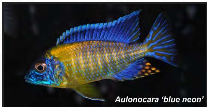
Aulonocara 'blue neon'

Hierop kan ik volmondig JAWEL antwoorden. Je hoeft zelfs geen doorwinterd kweker te zijn om het verschil op te merken. Onlangs was ik bij een importeur een verse lading wildvang Aulonocara 'blue neon', een cichlide uit