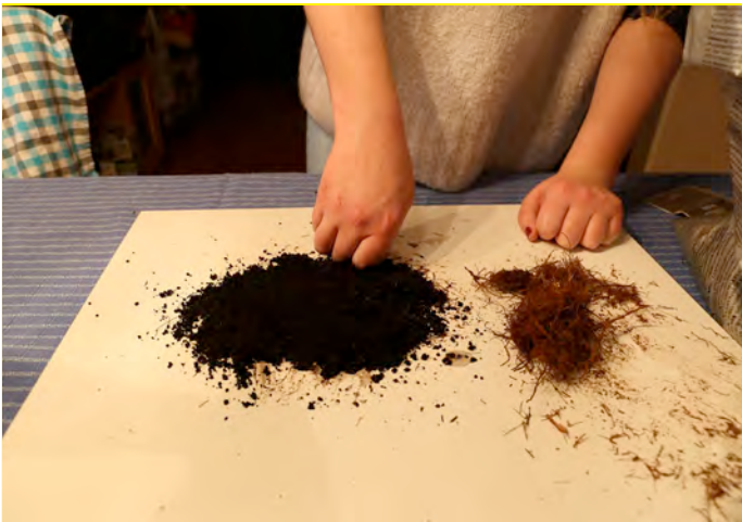
Gebruik 1 deel aquasoil en 1 deel kokosvezels