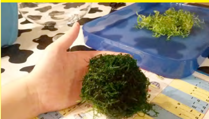
Wat mos en draad errond, en klaar!

Je kunt er ook voor kiezen om een bodem te maken zoals in een normaal aquarium, maar de meeste Wabi Kusa's gebruiken een balletje.