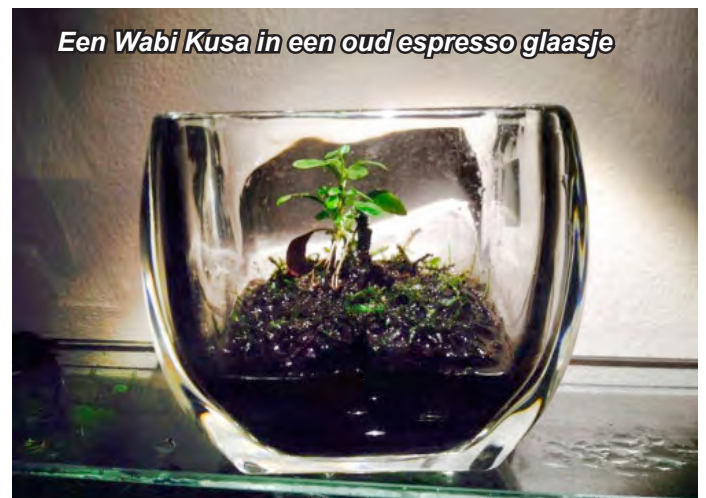
Een Wabi Kusa in een oud espresso glaasje