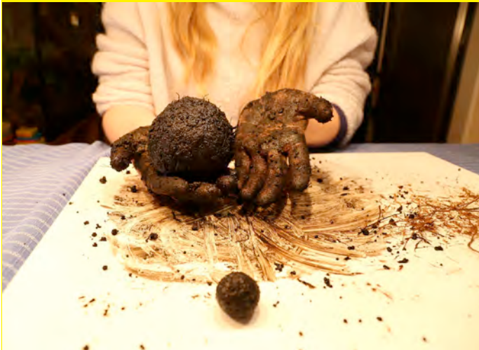
Met wat water en kneedwerk ziet het er zo uit